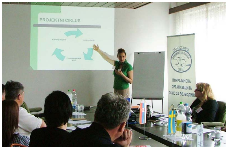
Radionica u okviru projekta Ulof Palme

InTER radi intenzivno sa ovim lokalnim organizacijama, pruža obuku, mentoring i podršku za razvoj veština odabranim predstavnicima organizacija. Izgradnja kapaciteta konkretno se odnosi na učenje različitih metoda i tehnika koje su neophodne organizacijama da bi pratile efikasnost svojih planova i implementacije. Intenzivan rad InTER-a na izgradnji kapaciteta započet je u poslednja dva meseca. Održane su ukupno četiri radionice, a peta je zakazana nakon leta. Ove prve u nizu radionica koje će se održati sa svakom od lokalnih organizacija pokrivaju sledeće oblasti: