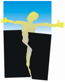
Helsinški odbor za ljudska prava u Srbiji

Osnovan 1994. godine, Helsinški odbor za ljudska prava u Srbiji počeo je svoju misiju tokom devedesetih godina prošlog veka, obeleženih etničkim nacionalizmom koji nije kulminirao samo u razarajućim ratovima, etničkom čišćenju, ratnim zločinima i genocidu u Bosni, već i masovnom kršenju ljudskih prava u Srbiji. Trenutno, u fokusu HO su istorijski revizionizam, normalizacija odnosa u regionu, pre svega između Srbije i Kosova, i globalni fenomen radikalizacije i nasilnog ekstremizma, kao i edukativni programi za mlade.