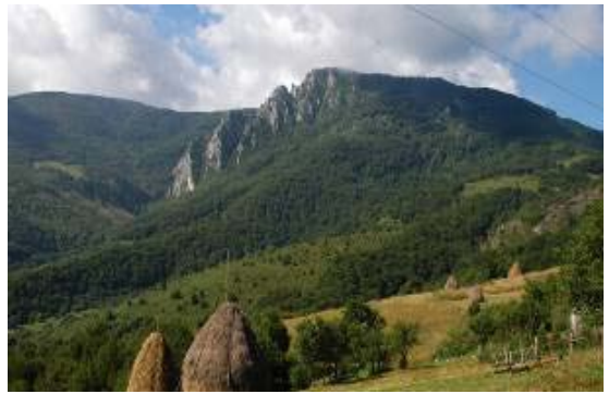
Predeo na planini Mokra Gora

Karakteristišu je predeli izuzetne lepote, povoljni za planinski turizam. Područje planine Rogozne odlikuje se sa velikom razuđenošću, nabranim reljefom i kosim strmim strnama. Najviši vrh Rogozne dostiže oko 1,479m.